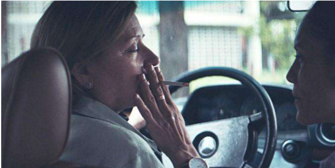
Imagen 3. Captura de pantalla del film Las herederas (Martinessi, 2018).

Después del velorio del marido de una de las pasajeras de su auto-taxi, Angy le pide a Chela hacer tiempo y tomar algo en su casa, ya que queda cerca del lugar. Se toman el vino en la casa de “Poupée”, destapado por Paty, a quien se le autoriza retirarse a descansar, inmediatamente después de esa tarea. Angy explora con curiosidad los detalles y recovecos de la casa, hasta que se tira en la cama matrimonial. Cuando Angy mira de frente a Chela, desde la cama, Chela no lo resiste y cierra la puerta. Rompe el entre y se queda en soledad, en su baño —otro escenario de la intimidad con Chiquita—, dando lugar para que Angy se vaya y ya no vuelva. Aparece otra vergüenza, esa que, según Probyn (2004), nos hace íntimas con nosotras mismas, a la vez que surge por una íntima proximidad con otras personas. Esta vergüenza es el cuerpo diciendo que no puede encajar, aunque lo desee desesperadamente.