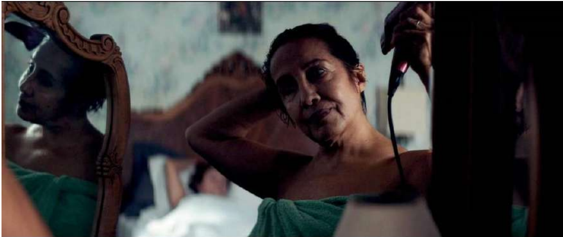
Imagen 2. Captura de pantalla del film Las herederas (Martinessi, 2018).

Lauren Berlant, pensadora y referente en los estudios sobre afectos, propone pensar críticamente las diversas formas de la intimidad, cuyo modo más reconocido y reconocible está vinculado a la intimidad pública. Es decir, por un lado, se establecen las modalidades de intimidad institucionalizadas en el marco de un sistema familiar, heterosexual, clasista, blanco, etc., –la narrativa que implica tener una vida –; y por otro, se encuentran las formas menores e invisibilizadas de construir intimidades –los encuentros fuera de canon, señalados como resto o residuo– (Berlant, 2020).