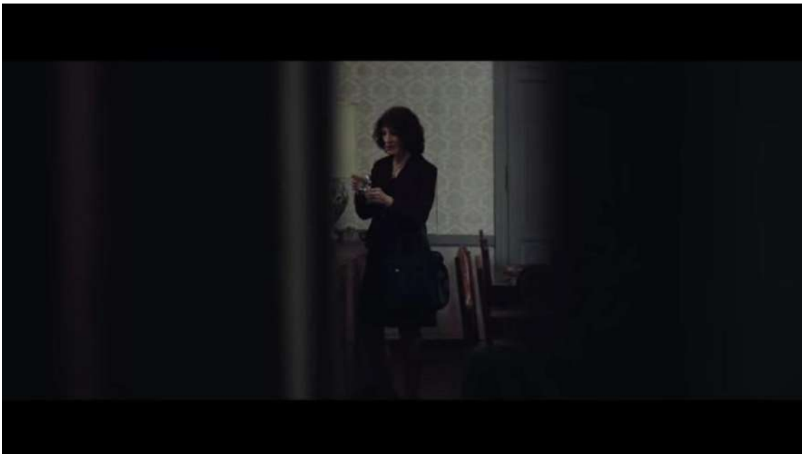
Imagen 1. Captura de pantalla del film Las herederas (Martinessi, 2018).

...poner en tela de juicio el marco no hace más que demostrar que este nunca incluyó realmente el escenario que se suponía que iba a describir, y que ya había algo fuera que hacía posible, reconocible, el sentido mismo del interior. (Butler, 2010, p. 24)